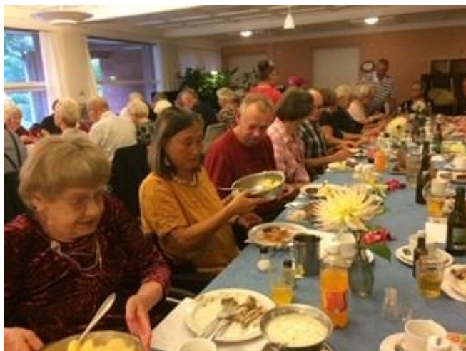
God mad på bordet

Jeg har nu boet i Låsby i 43 år og har igennem alle de år set, hvor fantastisk godt det er for Låsby, at vi har sådan et dejligt plejehjem - mit store ønske er, at byrådet vil beslutte, at Låsby permanent må beholde plejehjemmet / plejeboliger med et samlingslokale for pensionister i byen.