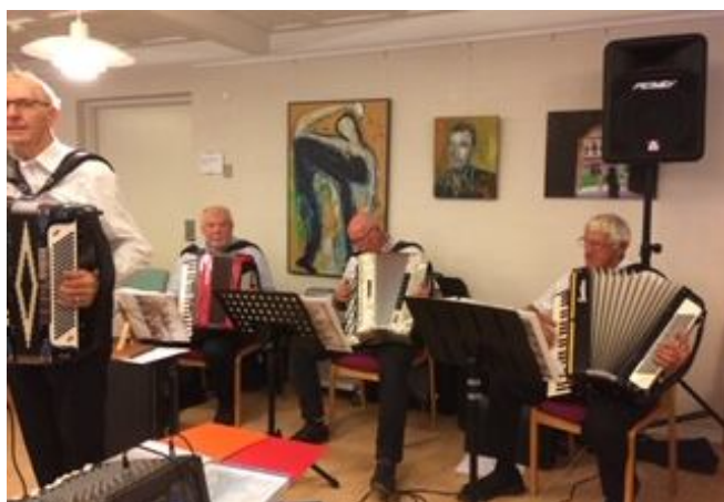
Sang og musik