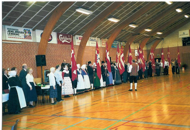
Fra festlige dage...

Vintersæsonen slutter til 1. april, så derfor kan vi nu kun lade op til en sæsonstart først i september.