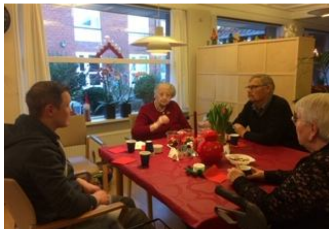
En god snak