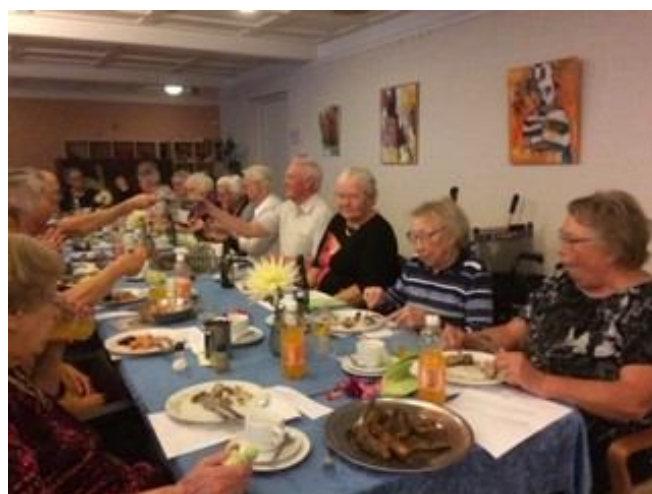
Mere god mad på bordet

Jeg håber, I vil prioritere i fremtiden, at Låsby må beholde plejehjem / plejeboliger.