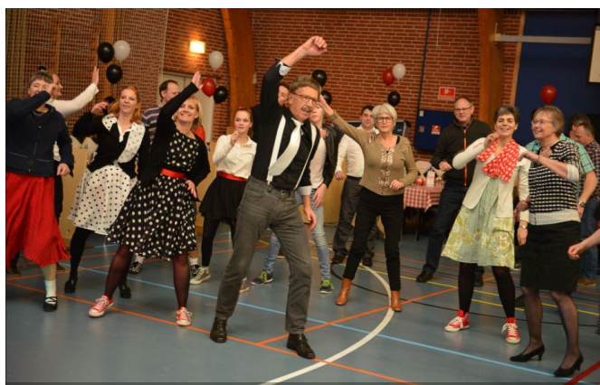
Fest i Låsby Hallen,,

til Låsby Hallens formand. Ifølge Låsby Hallens vedtægter §6 har hver forening, herunder Låsby Boldklub, én stemmeberettiget repræsentant per påbegyndt 50 betalende medlemmer. Fristen for at tilmelde sig som repræsentant er således overskredet, når du læser dette Låsbyblad, men det er fortsat muligt at deltage for repræsentanter tilmeldt efter deadline, de er blot ikke stemmeberettiget på repræsentantskabsmødet. Dette er en oplagt mulighed for at komme med og få indsigt i, hvad der rør sig i Låsby Hallen. Derfor bør du som medlem i Låsby Boldklub kraftigt overveje at deltage. Tilmelding kan ske via Christina@schmidthald.dk . OBS! Du eller dit barn skal være medlem i Låsby Boldklub, for at du kan deltage.