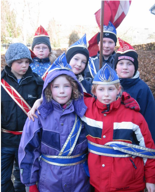
Der var engang...

vi vil gerne omstille til noget mere miljøvenlig opvarmning af huset. Her undersøger vi mulighederne for en luft-til-vand-pumpe, hvilket vi skal omkring energistyrelsen med i forhold til beregninger på størrelsen af pumpe, tilskud osv.