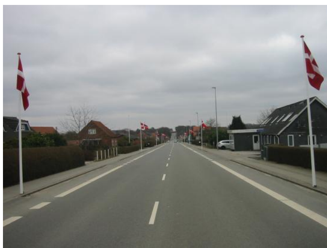
Gl. Silkeborgvej med flagalle

Derfor er vi lidt forsigtige med bare at lave en bunke huller. Men vi får flagallen lavet. Absolut.