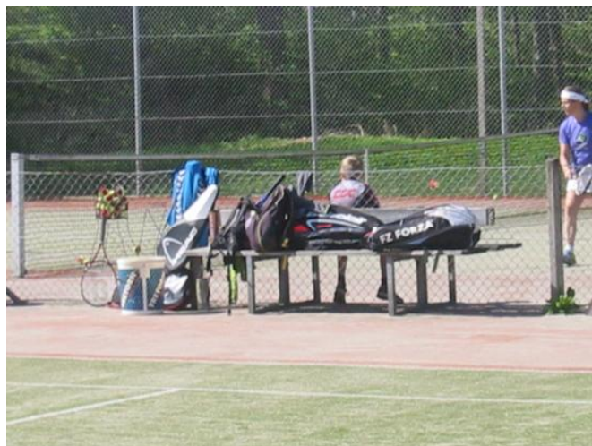
Standerhejsning, Tennissportens Dag