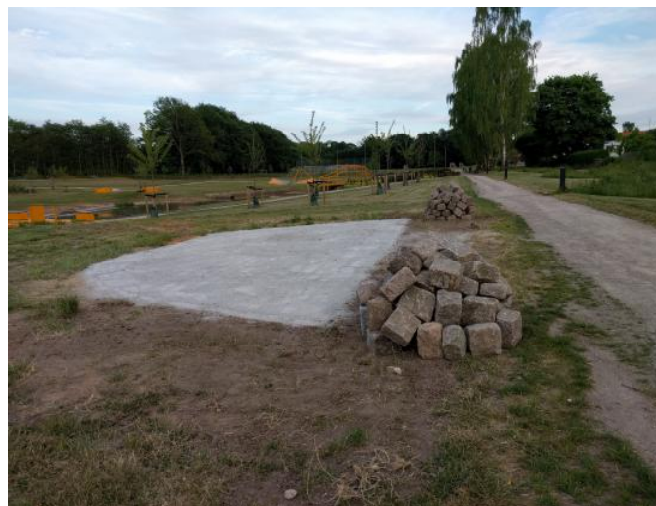
Den færdige plads

Har nogen lyst til at danse på pladsen, så er man velkommen. Stenmelet skal falde ned mellem stenene og sørge for, at de sidder godt fast. Derfor er det fint med lidt aktivitet på pladsen. Måske en kost og lidt tålmodighed var bedre, men en svingom lyder da hyggeligere.