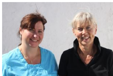
Tandlæge Ellen Larsen ApS Hovedgaden 62a, 8670 Låsby Tlf. 86 95 12 05

Vi har snakket trafik og sikker skolevej ad flere omgange, og selvom flere tiltag er foretaget, så er vi endnu ikke helt i mål. Der er på skolen +430 elever, +100 ansatte, busser/taxa omkring skolen samt naboer at tage hensyn til i trafikplanlægningen. Forslag og gode ideer modtages altid gerne af skolebestyrelsen som indspark til denne dialog. Formanden takker af efter denne sæson, det har været 8 spændende år i skolebestyrelsen, dog ikke som formand hele vejen. Vi har et godt samarbejde med ledelse og personale. Det har været varierende med elevengagementet og personligt ser jeg gerne mere input fra eleverne med henblik på at forme skolen, som de også gerne vil have den. Jeg overlader trygt stafetten til en ny skolebestyrelse, og jeg vil kun opfordre alle forældre til konstruktivt at engagere sig gennem forældremøder, forældreråd, forældre-arrangementer mv. Skolen