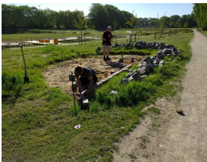
De indledende øvelser

Vi begyndte faktisk allerede i efteråret 2017, men da regnede det stort set hele tiden. Stedet lignede mere et sumpområde end en bålplds.