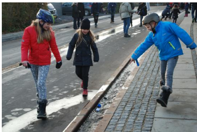
Anderæs på Byskallet

Tusind tak til alle, der har bidraget undervejs, og en særlig tak til jer, der mødte op og hjalp til at få indvielsen til at blive lige præcis den fest, det var tiltænkt! Af hjertet tak. Yes we can!