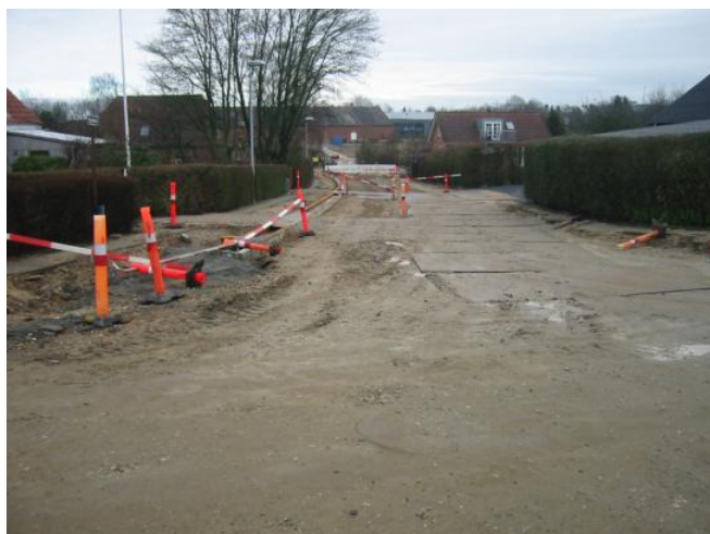
Byskellet – var her engang