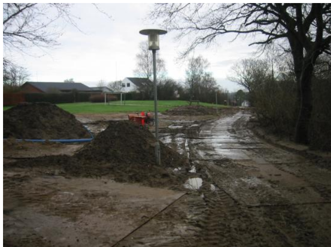
Det ”grønne” område