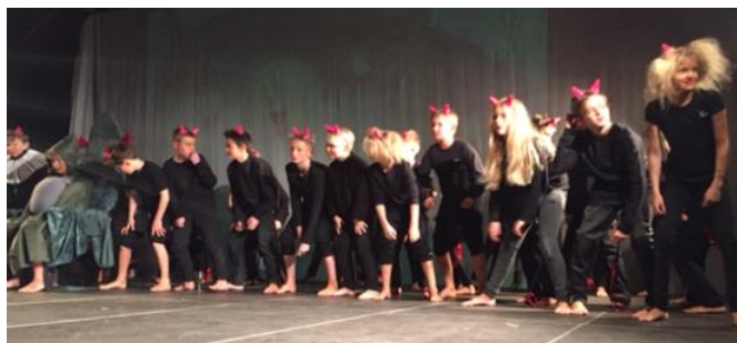
Skolefest torsdag d. 11. februar – Norske trolde

og øvet igen. Skolen sydede i ugens løb af engagement, kreativitet, gå på mod, hjælpsomhed, udholdenhed og masser af grin og smil. Der skulle syes kostumer, laves kulisser og meget meget mere.