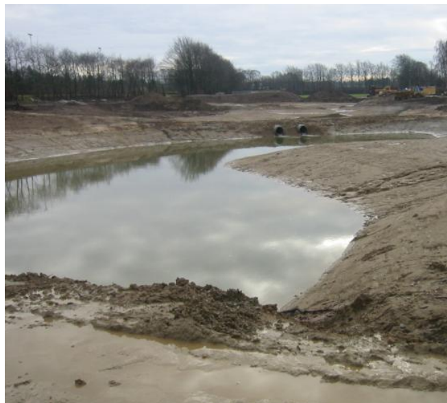
Ikke et hul. Det er en sø.