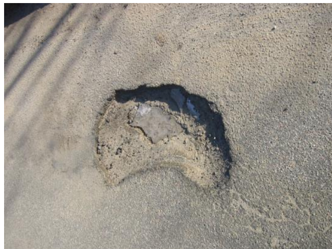
Hul i Hoved(gaden)