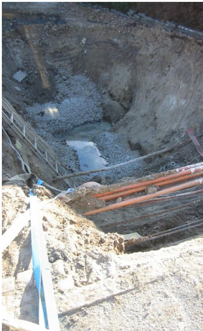
Sikke mange ting, der er i et hul