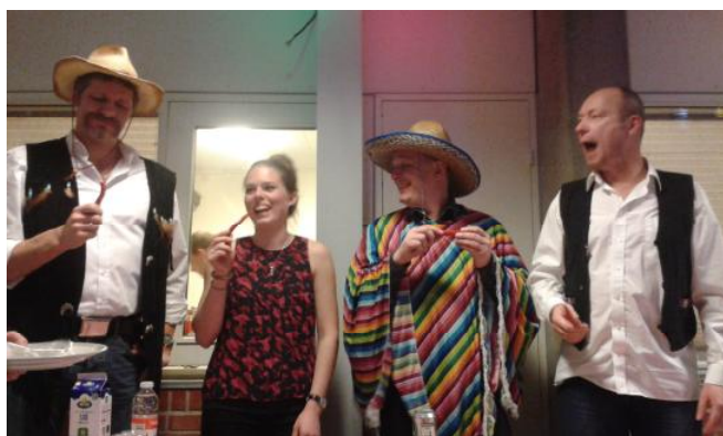
Hårdt prøvet chillismagningspanel