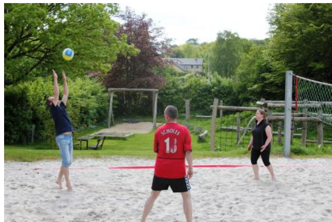
Herlig beachvolley i herligt solskin til sæsonstart.

D. 17.5 startede beachvolleysæsonen op med en hyggelig eftermiddag med masser af god beachvolley. Vi spiller, når vejret og tiden er til det. Alle kan være med. Det er gratis og uforpligtende. Man tilmelder sig på Låsby Boldklubs hjemmeside under 'Beachvolley', så får man en mail om, hvornår vi spiller næste gang.