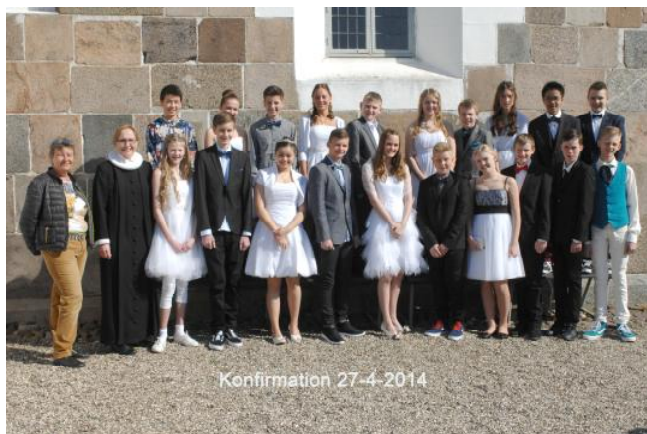
7.A, kl. 9.15

Men konfirmationsforberedelse er mere end forberedelse til en enkelt dag – det skulle gerne være forberedelsen til resten af livet – til hverdag og til fest. Konfirmationsforberedelsen er under pres pga. den nye skolereform, som mange taler om.