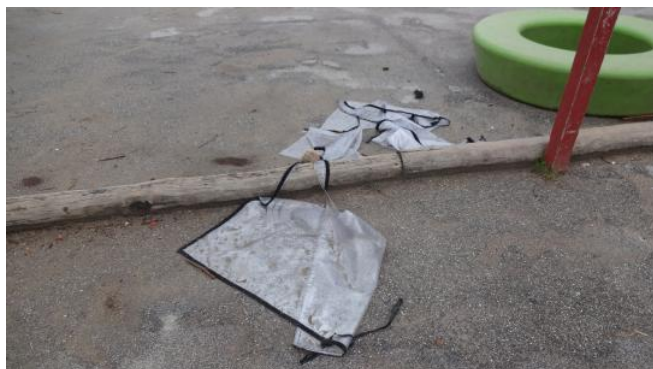
..ødelægge for så mange