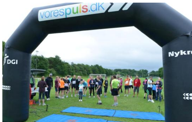
Låsby Løbet 2013: Et udpluk af løberne er ved at gøre sig klar i startområdet.

Under sommerfesten afvikles igen i år 12. juni Låsby Løbet, der i år ændrer navn til "EDC AROS Løbet". Dette skyldes, at EDC AROS i Galten har indgået et samarbejde med os i form af et sponsorat. Vi kan i år tilbyde alle interesserede at løbe en af de to korte ruter på enten 3,5 eller 7 km. De lidt mere ambitiøse har mulighed for at tilmelde sig halvmaratondistancen på hele 21 km. Løbet afvikles på en 3,5 km. rundstrækning i Låsby. For hver omgang passerer EDC AROS løberne start/målområdet på festpladsen, hvor familie og venner har mulighed for at heppe på løberne.