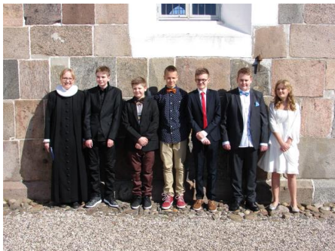
Konfirmation den 26.4.2014

En kulmination på 8 måneders forberedelse.