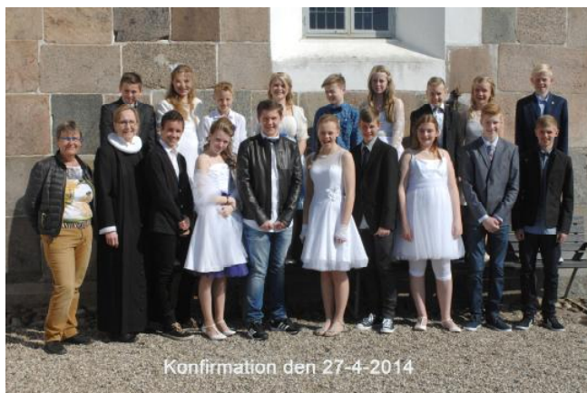
7.B, kl. 11.00

”Kampen” om de gode undervisningstidspunkter og de unge er i gang rundt omkring i det ganske land.