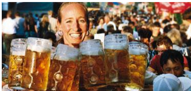
Wir sehen uns zum großen Party – dansk accepteres