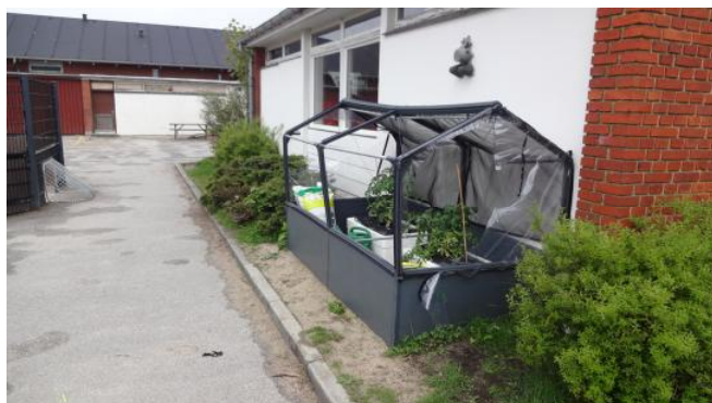
Så meget kan så få..

For et par uger siden mødte min datter og jeg ind i SFO'en til synet af dette - ting som igen var blevet ødelagt. Denne gang var det gået særdeles hårdt ud over drivhuset, hvor siderne var skåret eller revet af. Ligeledes var det gået ud over 2 bænke, som havde fået henholdsvis sæder og ben sparket af. Og det er ikke første gang, at SFO'en oplever, at deres ting ikke kan være i fred. Jeg bliver utrolig ked af, at nogen finder det morsomt at behandle andres ting på denne måde. Pædagogerne gør utrolig meget for at børnene trives i et hyggeligt miljø, men denne indsats kan nogle gange føles forgæves, fordi nogen få ødelægger det for alle. Derfor vil jeg gerne opfordre alle i Låsby til at holde et vågent øje med, hvad der sker i byen - i særdeleshed omkring SFO'en, så vi kan få sat en stopper for dette.