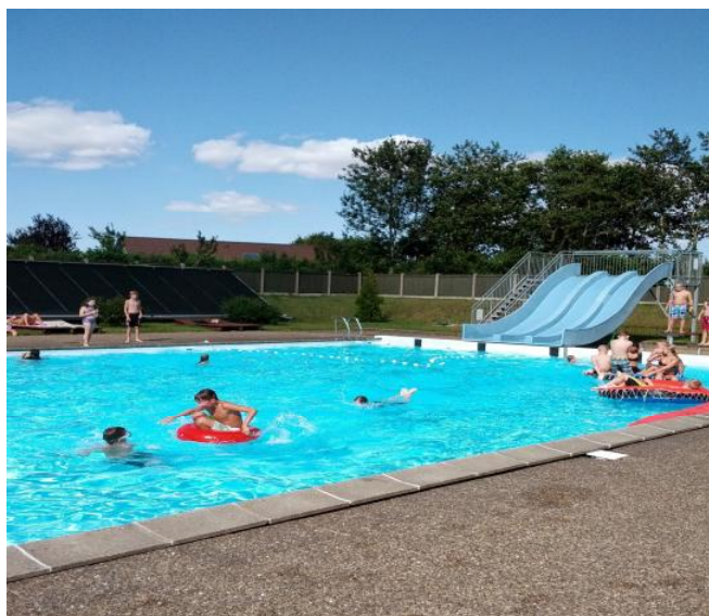
Hver onsdag fra 17-18 udskiftes de glade badegæster med glade vandgymnaster.