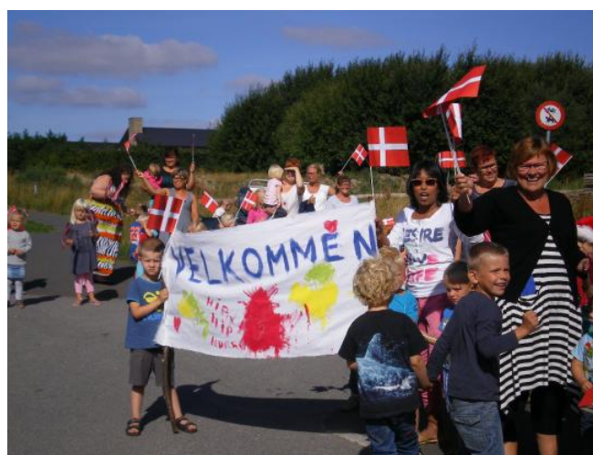
Velkommen til Viften

De største børn fra Viften hentede børn og voksne i Rønnehaven. De havde medbragt