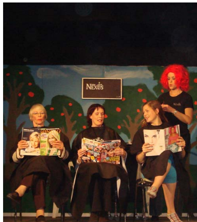
.. kam til dit hår.