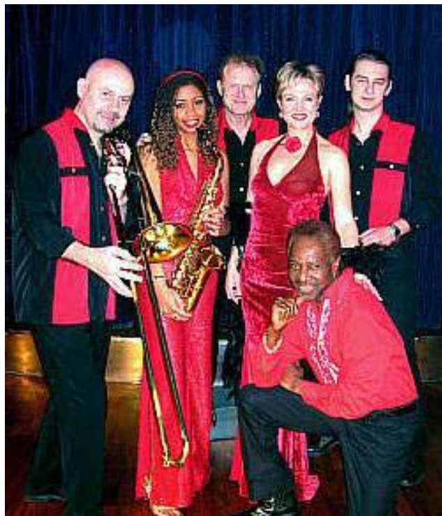
TRANS EUROPA EXPRESS

Julefrokosten 2008 er sat til lørdag den 29. nov. Så sæt allerede X i kalenderen, det bliver nogle gamle kendinge der spiller op til dans, nemlig FENDERS som også spillede til