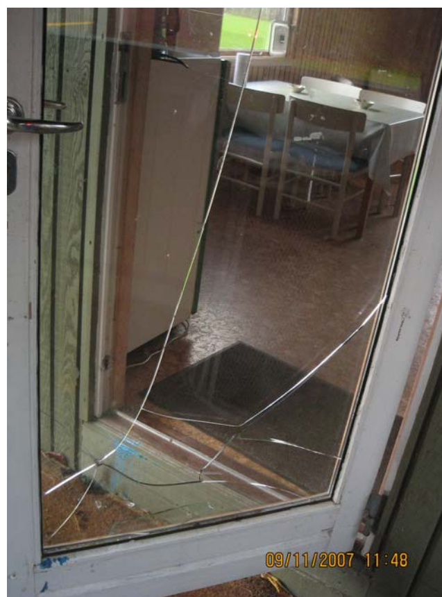
Itu – igen – igen!

Renovering af klubhuset står også på programmet i det nye år, bl.a. ny rude i døren, som ”sørme” er blevet smadret igen – igen. Utroligt!