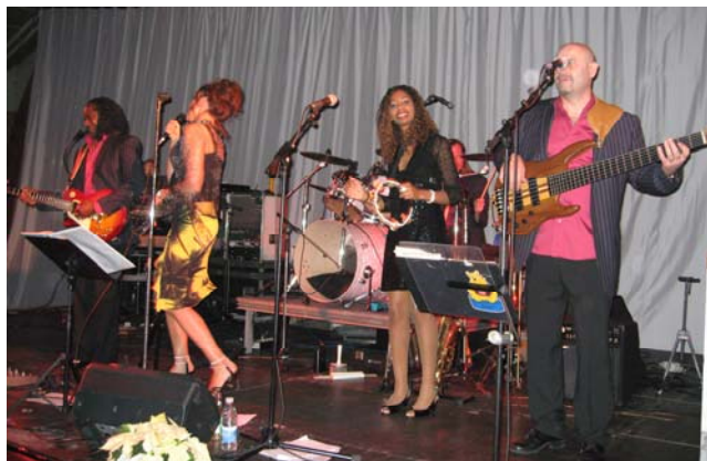
TRANS EUROPA EXPRESS – med lyd på

en god ide, at de kommer med ind over den kommende planlægning.