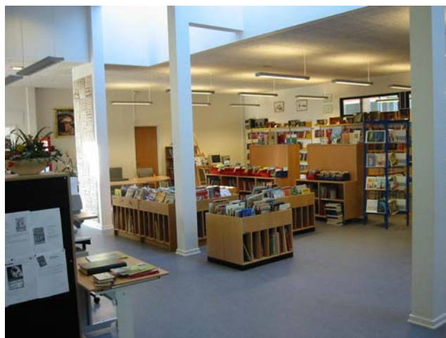
Låsby's nye bibliotek

Tanken om kombi-biblioteket er faktisk ikke ny. Det er en proces, der har et forløb over mange år. Den gælder da også kun for Gl. Rye og Låsby. Det skete i forbindelse med renovering og ombygning af de to skoler. Da jeg selv var elev på Låsby skole, i den sidste del af tresserne, var der også kun et bibliotek. De to biblioteker er ikke 100 % integreret, hvilket skyldes, de kører med hvert deres PC program. Det er utroligt dyrt at integrere de to programmer. Selvom afstanden mellem de