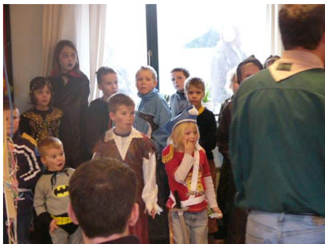
Fastelavnfest i Grønnebo