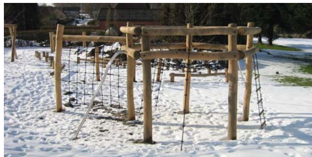
Naturlegepladsen i februar 2005

Daglejebørn og børnehavebørn kan mødes på naturlegepladsen ved hallen og lege. Pædagoger og dagplejere kan sætte sig ved bordene og herfra overskue børnenes leg. Legepladsen er dog ikke helt færdig endnu. Over-