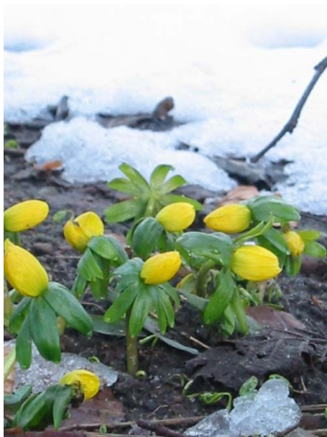
Der er andet i verden end sne.

ment i samarbejde med KFUM spejderne, Låsby, og vi vil gerne takke sponsorerne for godteposer - Nordea 75 poser, Super Best 150 poser og Focus 30 poser. Tak til Låsby Vognmandsforretning for årets juletræ.