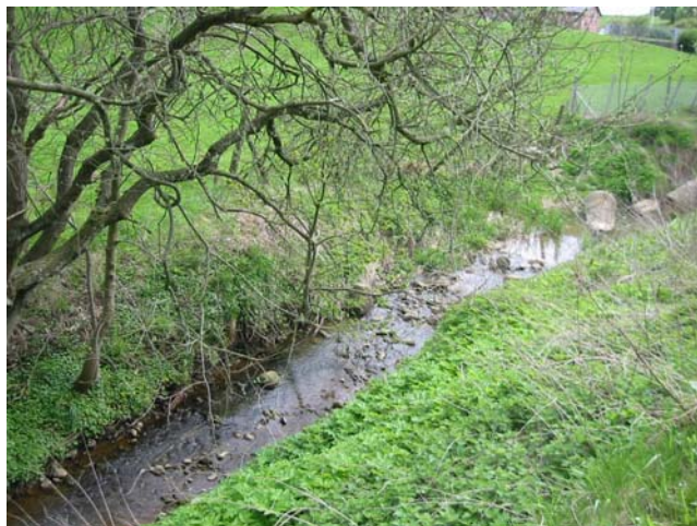
Låsby ... og omegn..

Beboerforeningen er organisatorisk omdrejningspunkt i en lang række aktiviteter i Låsby, og i forbindelse med medlemshverve-kampagnen blev der, i løbet af sommeren, rundsendt en lille folder i Låsby, hvor bestyrelsen gjorde rede for de aktiviteter man står bag, og hvilke nye tiltag der kommer i fremtiden.