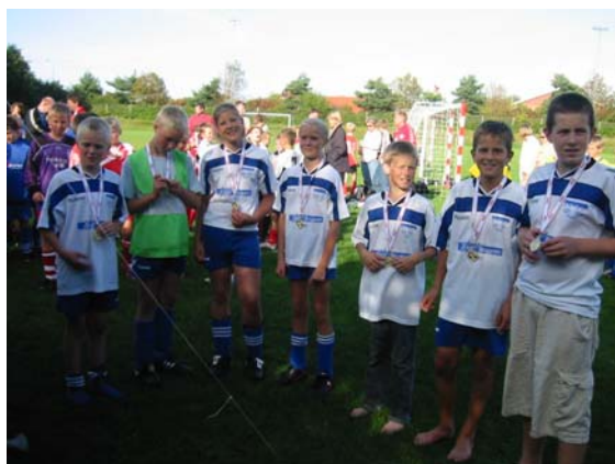
Låsby's ene hold ved medaljeoverrækkelsen

2. pladsen gik som nævnt til Ry, og blev derved i kommunen, og 3. pladsen gik til Laboe's 2. hold. Det kunne ikke have været planlagt bedre – selv om det så havde været aftalt spil.