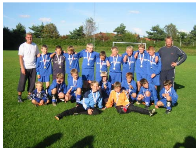
Smuk, symmetrisk opstilling af de to tyske hold fra Laboe med spillere, trænere – og 3 små søskende.

Lige efter håndboldkampen kørte vores venner fra Laboe, for de skulle jo nå hjem og se deres herrer spille håndboldfinale mod Kroatien (og det gik ikke helt så godt, set med tyske øjne).