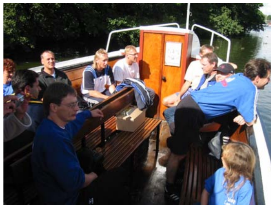
De voksne nød sejlturen i fulde drag

Ved Himmelbjerget havde vi fået bevilget et