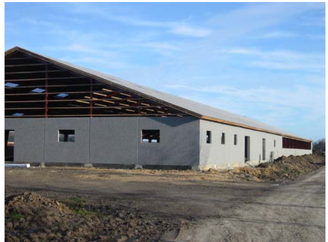
Den kommende stald

dens gamle udlænger stammer fra 1904 og kan slet ikke rumme den besætning, som gårdens nuværende areal svarer til.