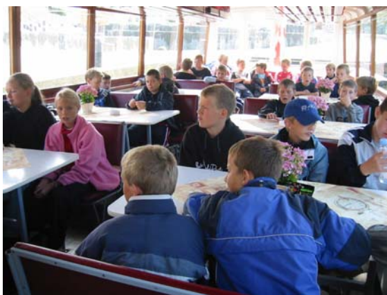
Lidt matte, ”dagen derpå”-ungdomsspillere på sejltur

Efter fælles morgenmad gik turen til Ry, hvor vi havde bestilt plads på en af Himmelbjergbådene for at vise Søhøjlandet lidt frem. Det var endda så fornemt, at vi stort set havde båden helt for os selv, så det blev vores gæster ret imponerede over.