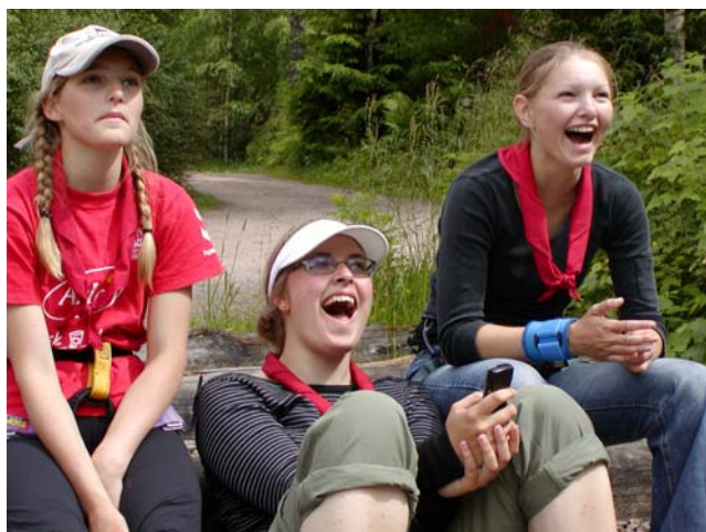
Danske grin i svenske skove

Menighedsrådet – Kirkens Hus Torsdag den 9. september kl. 19 30 Orienteringsmøde vedr. menighedsrådsvalg i november.