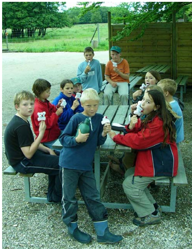
Ulve og bævere kan godt lide at gnave i...

Har du tid kan ”værket” læses på side 7.