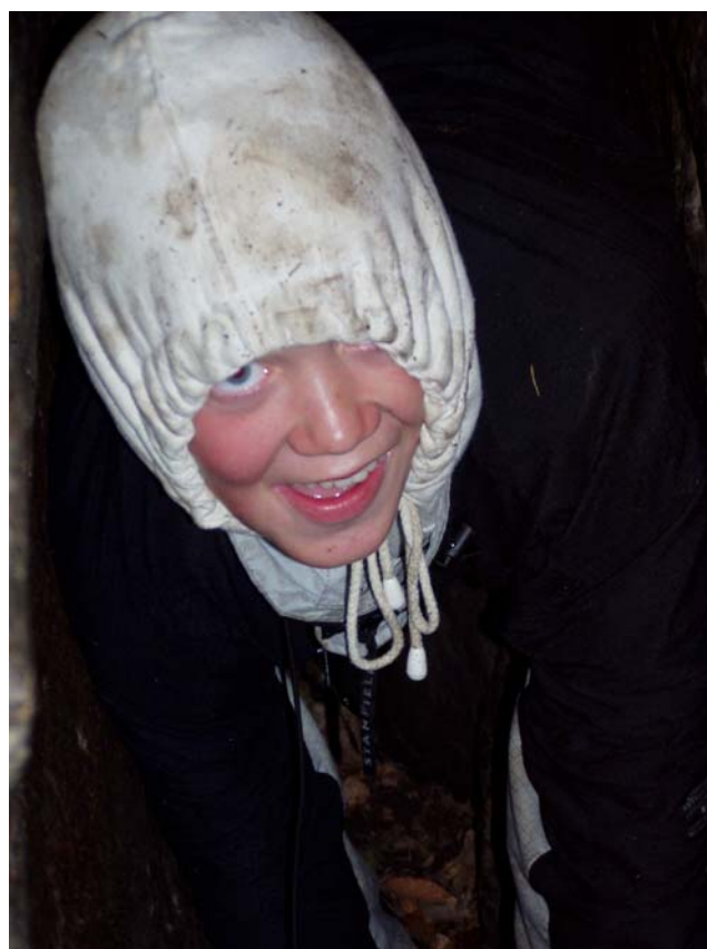
Svensk regnvejr og godt humør