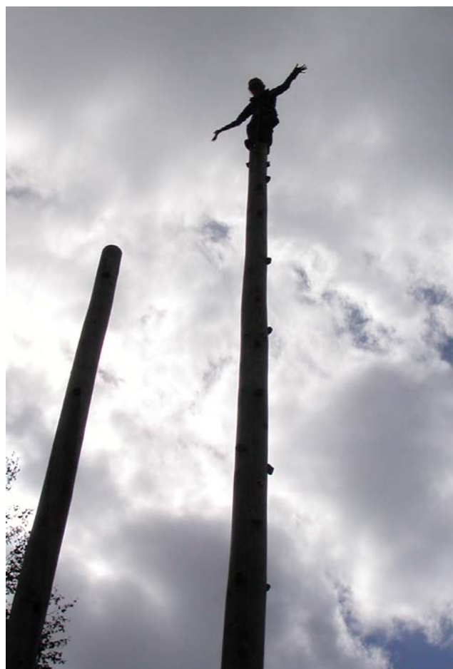
Spejder på en pind..