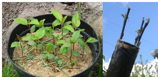
Nye generationer på vej...