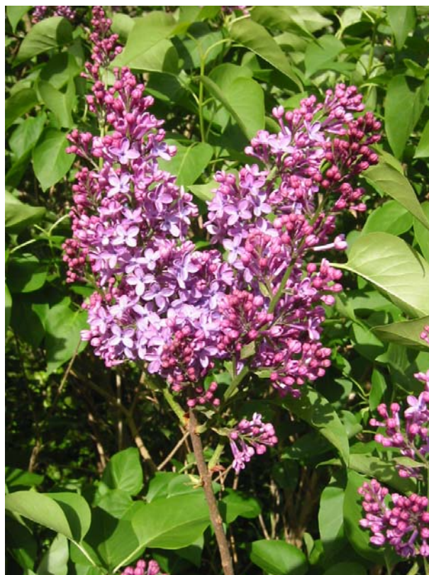
En syren....hverken hvid .....eller løgn.....

tioner. Nogle mennesker har et handicap, der gør, at de ikke kan lyve, og det kan blive en af de største vanskeligheder, som disse personer har. De får simpelthen svært ved at begå sig blandt andre mennesker, fordi de ikke kan sætte sig i andres sted og vurdere, hvornår sandheden gør mere skade end en (hvid) løgn.