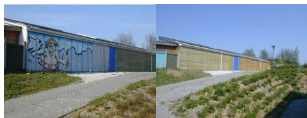
Facade under renovering.. Færdigt arbejde

Desværre havde journalisten ikke sat sig ordentlig ind i regnskabet, idet udgiftssiden også indeholder en post på 82.862 kr. som er benævnt NYANSKAFFELSER