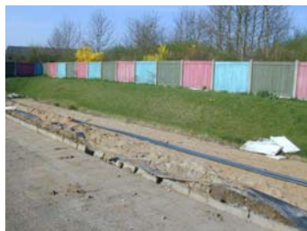
Den nye solplads er straks færdig.

BG Bank, Ry Danske Bank, Ry Baby Dan Nordea Låsby Multisol Låsby Byg Laven Motormølle SuperBest, Låsby Laasby Vognmandsforretning Realmæglerne Ry Automester Låsby Sparekassen, Ry JB Taxi Ole's Minilæsserudlejning Hos Jørgen Bak Låsby Smede- & Maskinforretning Låsby Grillen.