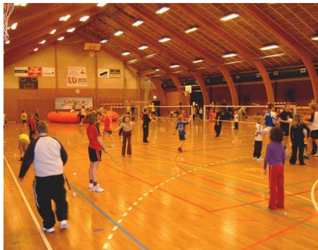
Laaaaaang Nat 19. marts 2004.

Alle børn skal uanset niveau og erfaring deltage i kampe og stævner og have spilletid. Igennem stævner og lokale aktiviteter som "Laaaang nat" i hallen arbejder Låsby håndbold på at skabe mulighed for samvær på tværs af alder og køn og her igennem udvikle og træne sociale færdigheder.