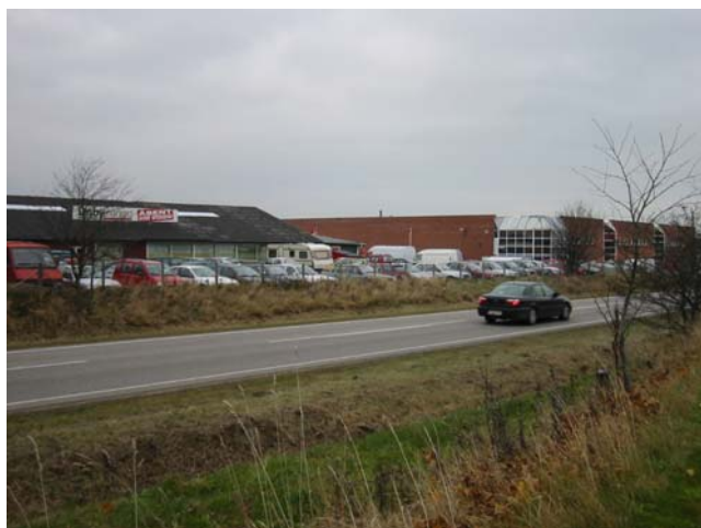
Måske ikke den smukkeste facade

Det skal jo ikke ligne forhaverne i Skovbrynet eller Fredensborg Slotshave, men det kunne ikke gøre noget, at det lignede noget. Det ligner altså også noget, vil nogen hævde. Jeg giver dem fuldstændig ret. Det ligner noget. Noget.....som er løgn. Hvis nogen skulle være i tvivl, så er det området mellem Hammelvej og Ole Rømers Vej, der står for skud.