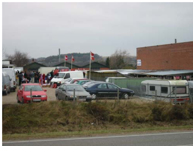
Velkommen i skuret

Låsby skal have et marked f.eks. Det Blå Marked.